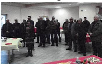
Les habitants informés des travaux à venir.