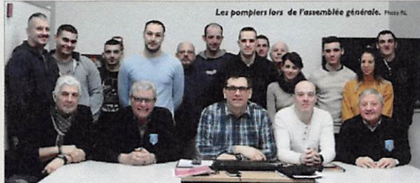
Les pompiers lors de l'assemblée générale.

l'écusson du Luxembourg, du Duc de Lorraine, du duc de Barr, le Graouly symbolisé, en honneur de la ville de Metz, du fond bleu qui symbolise le fleuve la Moselle et bien sûr le drapeau français. Des travaux de rénovation dans le vestiaire sont également prévus cette année. Les manifestations prévues en 2018 : 10 juin portes ouvertes à compter de 11h:30 jusqu'à la Saint-Jean place du marché; 13 juillet bal populaire et feu d'artifice; le 25 août participation aux noces d'or du jumelage avec leurs homologues allemands; 30 novembre fête de la Sainte-Barbe. Le lieutenant Zimmermann recherche des personnes volontaires motivées, disponibles et aptes physiquement pour renforcer les effectifs.