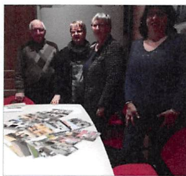
Le jury note impartialement les maisons par rapport à leur fleurissement.